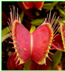
la dionée attrape-mouche

Les plantes carnivores vivent dans des milieux très pauvres tels que des marais, des tourbières, des parois rocheuses... qui ne renferment pas suffisamment d' éléments nutritifs . Elles doivent donc trouver un autre moyen d'acquérir ces substances tant nécessaires à leur croissance.