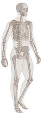
Les os - Le squelette

(le fémur, le tibia, la colonne vertébrale...)