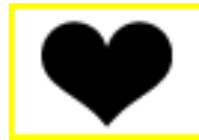
Mode de vie