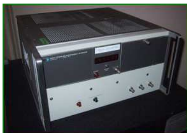
une horloge atomique