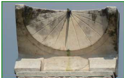
un cadran solaire