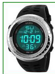
une montre connectée

une montre électronique // une bougie graduée // une horloge mécanique // un cadran solaire une bougie graduée // une horloge atomique // une clepsydre // une montre mécanique