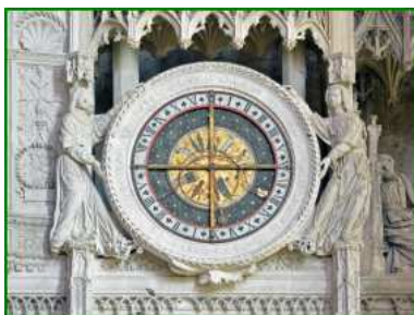
une horloge mécanique