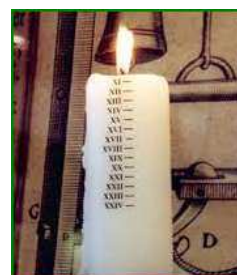
une bougie graduée