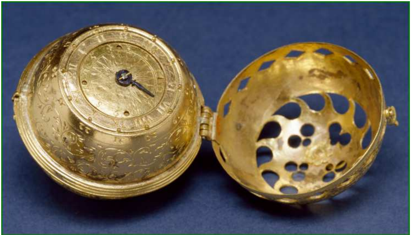
La plus vieille montre connue date de 1530.

Document : de la première montre à la montre connectée