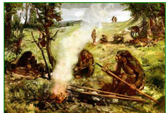
Avant la chasse

La découverte des lances et du propulseur lui permet de chasser des animaux plus gros comme le mammoth, le bison ou le renne.