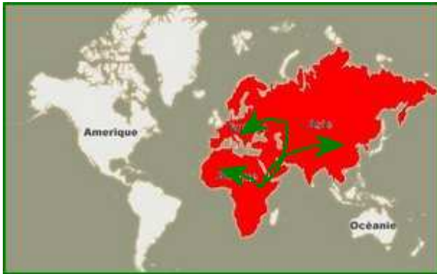
Homo erectus se répand en Asie et en Europe

L' Homo erectus ( homme debout ) est apparu il y a deux millions d'années en Afrique. De là, il part vers d'autres continents, à la recherche de proies devenues rares suite à l'assèchement du climat en Afrique.