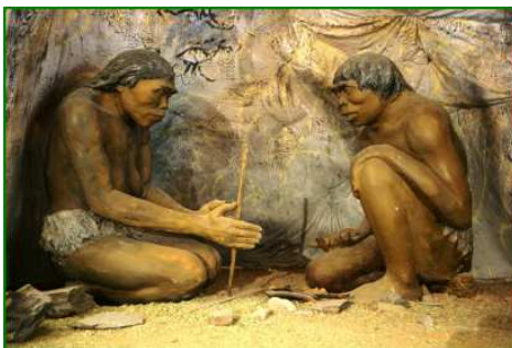
Préparation du feu

Il y a 400 000 ans, il découvre le feu et va parvenir à le maîtriser.