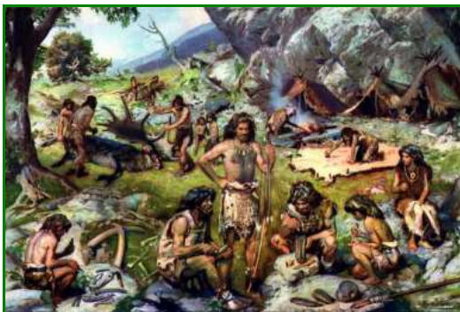
Un campement à la fin du Paléolithique, il y a 10 000 ans