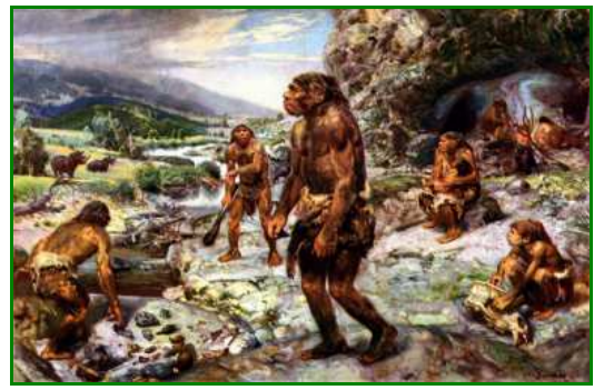
Un campement d'Homo erectus, il y a 300 000 ans