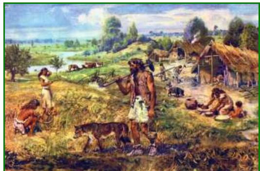
Un village au Néolithique, il y a 4 000 ans