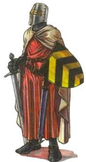
Chevalier du XIII e siècle