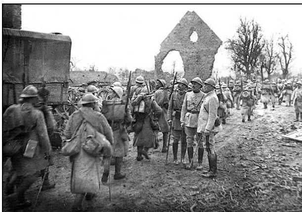
Les poilus sur le front - 1915

En août 1914, la guerre semble « fraîche et joyeuse ». Personne n'imagine l'ampleur de la tragédie qui commence et son coût humain. Chacun est persuadé d'avoir le droit pour lui.