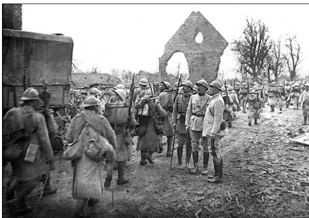
Les poilus sur le front - 1915

En août 1914, la guerre semble « fraîche et joyeuse ». Personne n'imagine l'ampleur de la tragédie qui commence et son coût humain. Chacun est persuadé d'avoir le droit pour lui.