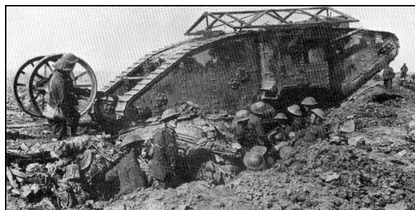
Char anglais - 1918

Ces renforts permettent au maréchal Foch de lancer en été 1918 une série de contre-offensives qui oblige les Allemands à reculer.