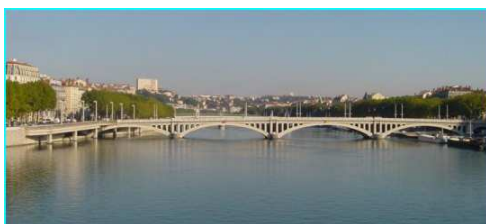
Le Rhône à Lyon

Les principaux fleuves sont la Loire , une partie du Rhône qui prend sa source en Suisse, la Garonne , la Seine et une partie du Rhin (qui traverse plusieurs pays) et sert de frontière entre la France et l'Allemagne.