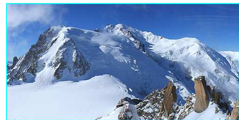
Le Mont Blanc dans les Alpes

Les principaux fleuves sont la Loire , une partie du Rhône qui prend sa source en Suisse, la Garonne , la Seine et une partie du Rhin (qui traverse plusieurs pays) et sert de frontière entre la France et l'Allemagne.