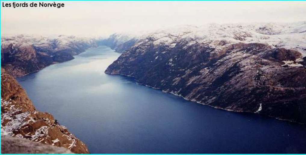
Les fjords de Norvège