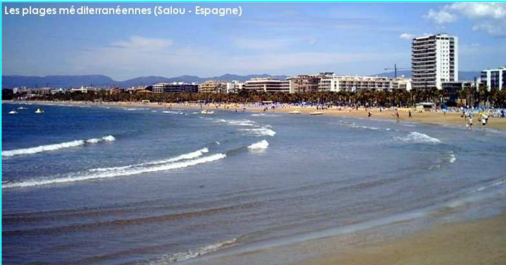
Les plages méditerranéennes (Salou - Espagne)