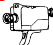
une cam é ra