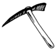
une pio o che