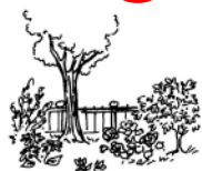
un j ardin