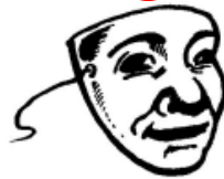
un mas q ue