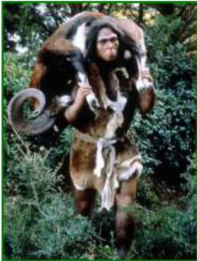
Un chasseur du Paléolithique

Le Paléolithique : l'âge de la pierre taillée