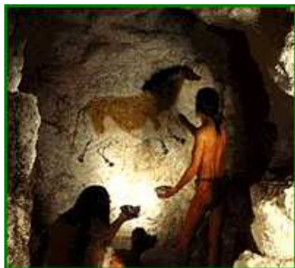
Peintures au paléolithique

Pour les périodes les plus anciennes, ce sont des galets à peine retouchés par la percussion d'une pierre sur une autre, ce qui crée une arête vive. Pour les périodes les plus récentes, ce sont des lames minces et longues en forme de feuille de laurier . Avec la même quantité de matériau, l'homme a réussi à augmenter considérablement la quantité d'outils et la longueur du tranchant. Il est donc beaucoup plus efficace pour se procurer et préparer sa nourriture.