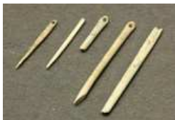
Aiguilles en os

Ils prenaient également les os des animaux pour fabriquer des aiguilles ou des harpons . L'utilisation du feu a également permis de diversifier des outils qui se spécialisent.