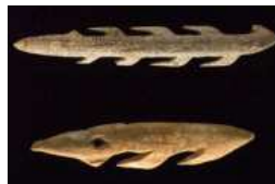
Harpons en os