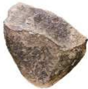
Le galet aménagé

Au Paléolithique , les premiers outils utilisés par les premiers hommes sont de simples pierres et de grossiers gourdins de bois. Les premiers hommes fabriquent des outils en frappant deux galets l'un contre l'autre.