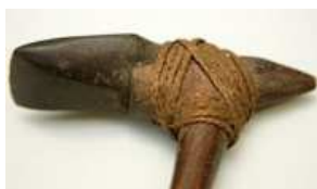
Hache (pierre + bois)

Au Néolithique , apparaissent les outils en pierre polie ( haches et pics de silex montés sur des manches en bois). Les premiers agriculteurs fabriquent de nouveaux objets : meules en pierre pour écraser le grain, faucilles pour couper le blé et toutes sortes de poteries pour la conservation des aliments.