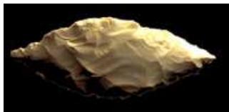
Feuille de laurier

Les hommes préhistoriques fabriquaient des outils pour se nourrir ou améliorer leurs conditions de vie. Les outils leur servaient avant tout à découper les morceaux de viande ou la peau sur les cadavres d'animaux.