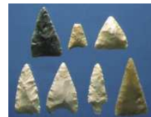
Pointes de flèches en pierre