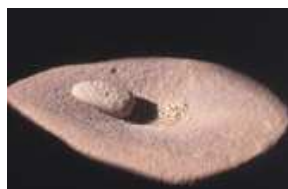
Meule en pierre