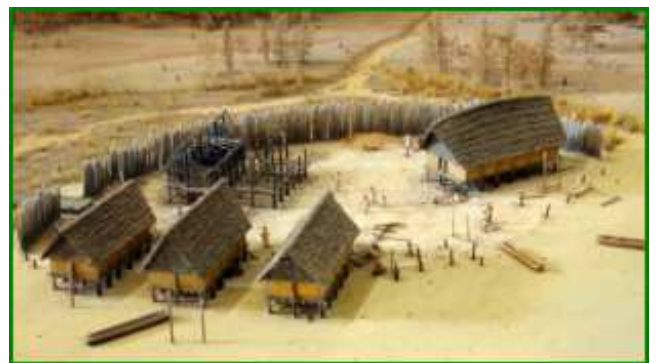
un village au néolithique

Le fait de construire des villages s'accompagne de la fabrication d' outils spécifiques pour de nouvelles activités : le tissage et la poterie naissent, qui permettent, l'un d'utiliser les fibres produites (la laine , ou le chanvre par exemple), l'autre de stocker les boissons et la nourriture.