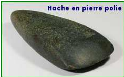
Hache en pierre polie

Suite au Paléolithique , plusieurs évolutions vont se répandre dans les populations humaines. Mais ce passage s'est produit progressivement, en fonction des conditions d'habitats des premiers hommes.