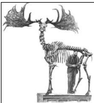
Squelette d'un mégacéros