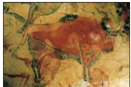
Peinture rupestre d'un bison

Le bison des steppes Le bison des steppes a disparu il y environ 10 000 ans, soit à la fin de la dernière glaciation. Apparu il y a plus de 900 000 ans en Asie du Sud, il est caractéristique des milieux froids et ouverts comme la steppe. Cette espèce a donc été très couramment chassée par les hommes du Paléolithique. Les paléontologues ont décrit 9 espèces de bisons aujourd'hui éteintes.