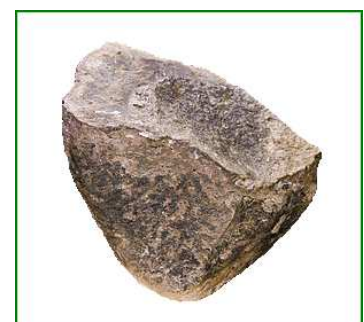
Les premiers outils

L' Homo habilis vit en petits groupes qui se déplacent pour chercher leur nourriture. Il est donc nomade .