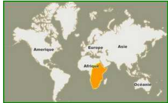
Homo habilis est apparu en Afrique de l'est

L' Homo habilis est apparu il y a plus de 2,5 millions d'années dans l'est de l' Afrique et a vécu jusqu'à 1,8 millions d'années.