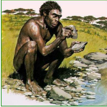
Homo habilis est le premier à se servir d'outils

L'Homo habilis (homme adroit ou homme habile) est considéré comme l'un des tous premiers représentants de l'espèce humaine.