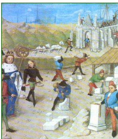
La construction d'une cathédrale

Le Moyen Âge est également marqué par le fort essor de la religion catholique en France et en Europe. Cette religion devient celle des rois de France (avec le baptême de Clovis vers 498).