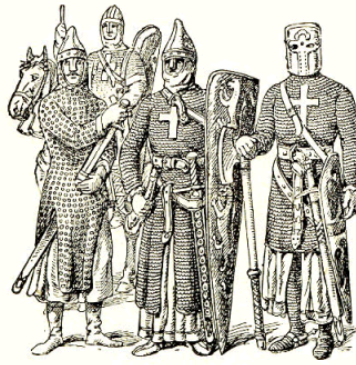
Croisades (XI e -XIII e siècles).