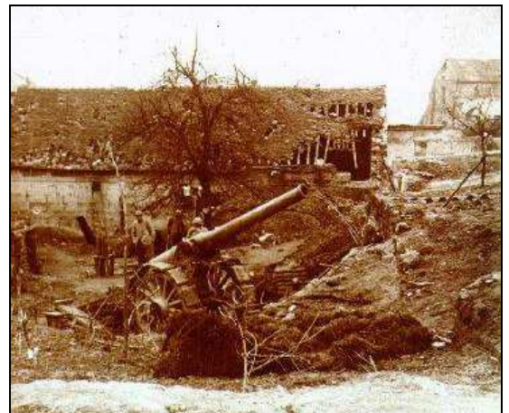
Pièce d'artillerie de 155 - 1914

En quelques jours, les Allemands s'emparent de la quasi-totalité de la Belgique, malgré la courageuse résistance des soldats d'Albert 1 er . Du 20 au 23 août, l'armée franco-anglaise est défaite à Charleroi et l'avalanche ennemie déferle vers Paris. Le général Joffre ordonne un repli vers la Seine et se prépare à la contre-attaque de la dernière chance. Pour protéger Paris, son gouverneur, Gallieni, réquisitionne les « taxis de la Marne » qui amènent des renforts sur ce fleuve. Joffre attaque le 5 septembre et, non seulement contient l'ennemi, mais il le repousse.