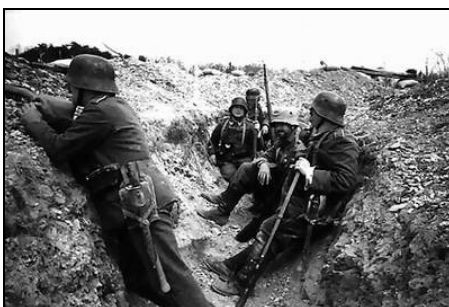
Dans les tranchées - 1916

L'Allemagne est en guerre sur deux fronts : à l'ouest contre la France et l'Angleterre, à l'est contre la Russie. Les forces en présence étant sensiblement égales, les offensives, d'un côté comme de l'autre, sont repoussées, souvent au prix de lourdes pertes. Les principales batailles ont lieu en Artois et en Champagne (1915), sur la Somme (1916) et sur l'Aisne (1917). La célèbre bataille de Verdun en 1916 montre la cruauté de cette guerre particulièrement meurtrière.