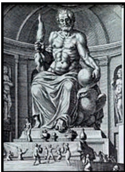
Statue de ZEUS à Olympie

Ces dieux, considérés comme tout-puissants, sont pourtant plus proches des hommes que dans les autres religions. Ils sont d'ailleurs représentés sous forme humaine.