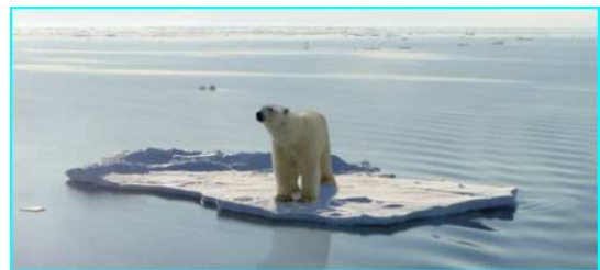
La banquise disparaît

Le réchauffement entraînerait une fonte des glaces et donc une augmentation du niveau de la mer (entre 9 et 88 cm). La banquise pourrait ainsi disparaître. Les précipitations augmenteraient et les tornades , les ouragans ou les tempêtes se produiraient plus souvent.