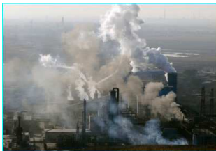
Les énergies fossiles sont très polluantes

Pour satisfaire la demande énergétique mondiale actuelle, les hommes puisent sans retenue dans les ressources énergétiques et particulièrement dans les énergies non renouvelables . Environ 80 % de l'énergie consommée dans le monde est d'origine fossile. Les énergies fossiles (charbon, pétrole, gaz, nucléaire) sont principalement utilisées pour le chauffage , les transports et l' industrie . Leur combustion est polluante et responsable de l'émission de gaz à effet de serre et du réchauffement climatique .