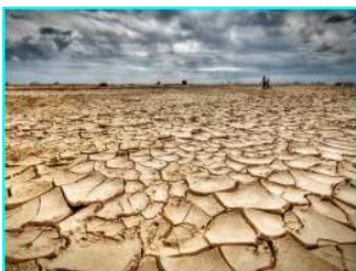
La déforestation entraîne la sécheresse

Les changements climatiques ont toujours existé. Ces changements varient entre période glaciaire et réchauffement de la planète : l'ère dans laquelle nous rentrons s'avère être la période de réchauffement de la planète. Mais ce réchauffement n'est pas seulement dû au changement habituel du climat ; celui-ci est dû pour la plus grande partie aux rejets de gaz à effet de serre (le dioxyde de carbone ou CO2 notamment) par l'homme.