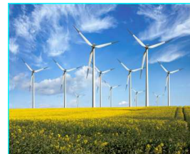
L'énergie éolienne est inépuisable

À la différence des énergies non renouvelables, les ressources énergétiques renouvelables (hydraulique, solaire, éolien, géothermie) se caractérisent par le fait qu'elles sont inépuisables et disponibles en grande quantité sous réserve de se donner les moyens de les exploiter.