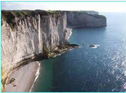
Côte à falaise