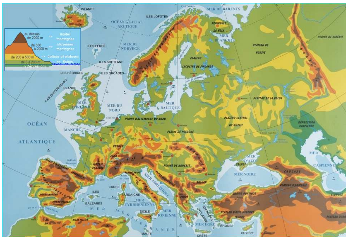
Carte du relief de l'Europe