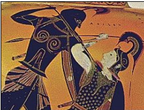
L'Iliade raconte la guerre de Troie

L' Iliade une épopée attribuée au poète Homère. Elle est divisée en 24 chants. Le texte a probablement été rédigé entre 850 et 750 av. J.-C. , soit quatre siècles après la période à laquelle les historiens font correspondre la guerre mythique qu'il relate.