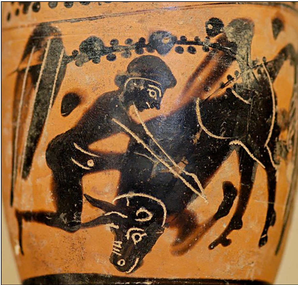
Héraclès et le taureau crétois de Minos, cadeau de Poséidon