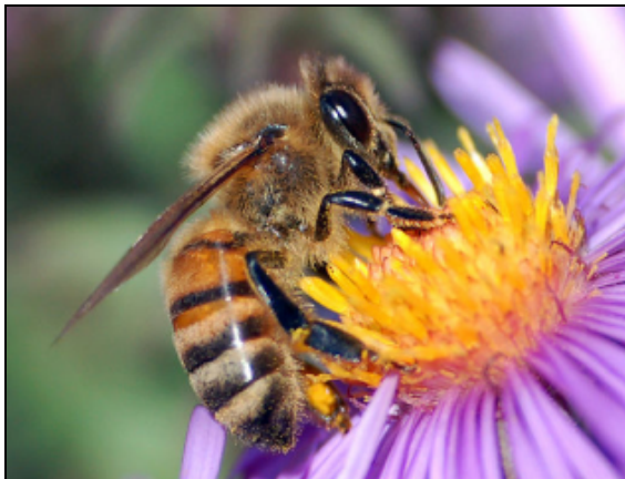
Abeille européenne prélevant du nectar d'une fleur

Sauvages ou domestiquées, elles sont essentiellement composées d'espèces du genre Apis . En apiculture, l'abeille la plus utilisée dans le monde en raison de son haut rendement en miel et de son tempérament assez calme est l'abeille domestique occidentale (originaire d'Asie de l'Ouest, d'Europe et d'Afrique), dite aussi, par exemple, « abeille européenne » (nom scientifique : Apis mellifera ).